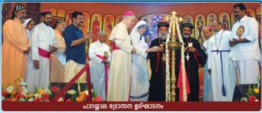
പാറ്റുലായ ഭദ്രാസന ഉദ്ഘാടനം