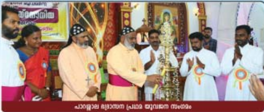
പാറ്റുലായ ഭദ്രാസന പ്രഥമ യുവജന സഭയ്ക്കു