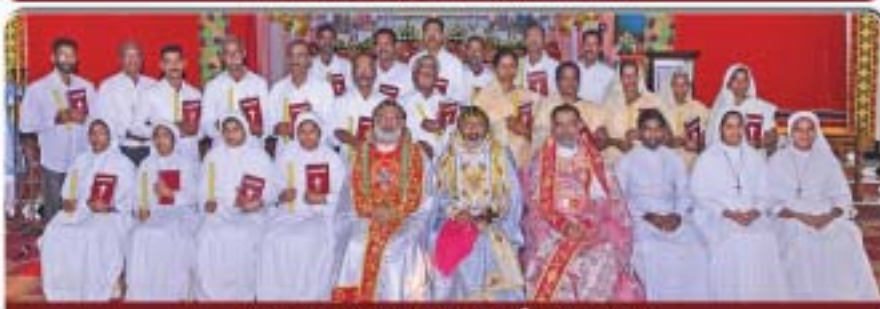
പാറ്റുലായ ഭദ്രാസന പ്രഥമ സുവിഭജനസംഘം