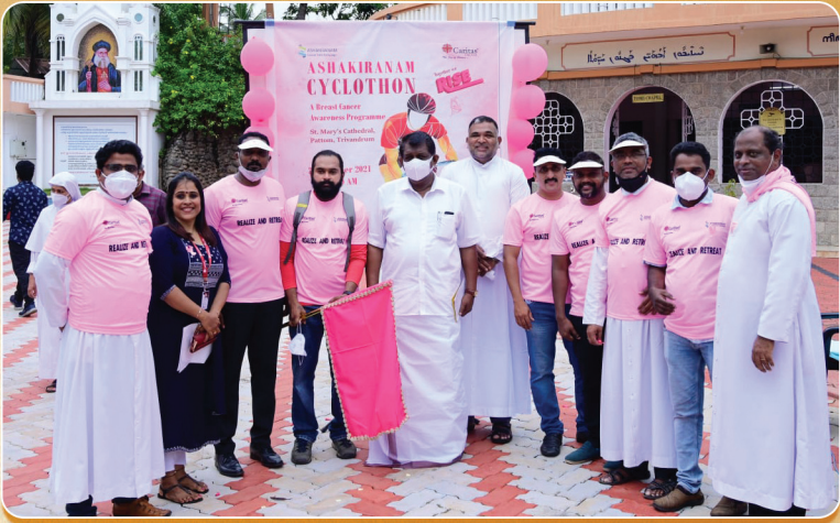
കാരിത്താസ് ഇന്ത്യ സംഘടിപ്പിച്ച സൈക്ലത്തോൺ