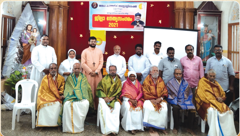
മലകര കാത്തലിക് അസോസിയേഷൻ പാറശ്ശാല ഭദ്രാസന സമിതിയുടെ ആഭിമുഖ്യത്തിൽ മുൻകാല ഭാരവാഹികളെ ആദരിച്ച ചടങ്ങ്