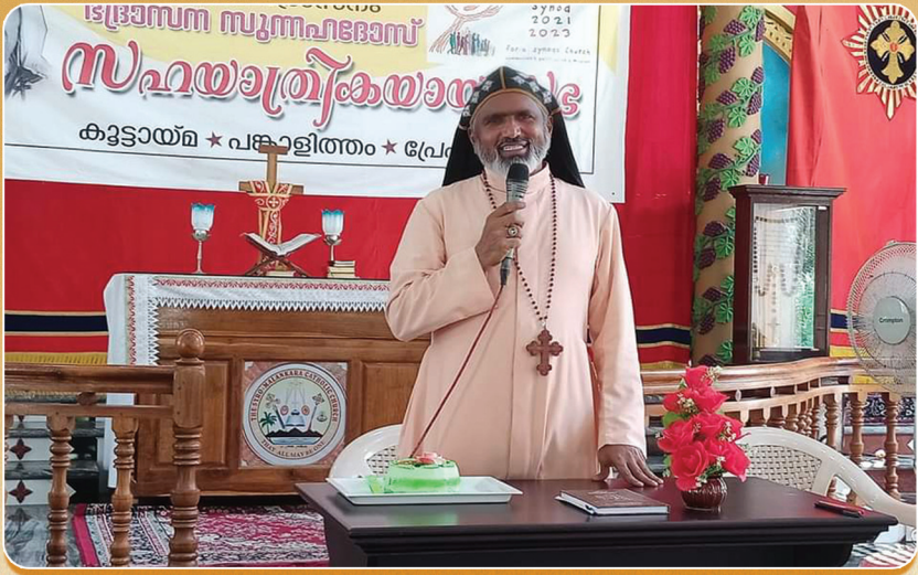
സഹയാത്രികയായ സഭ ഭദ്രാസന സുന്നഹദോസ് ഉദ്ഘാടനം