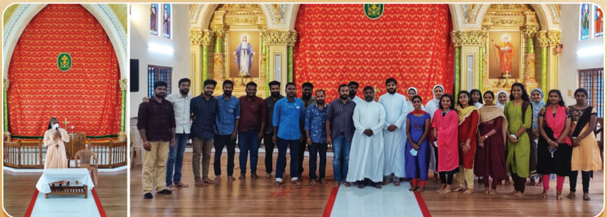
എം.സി.വൈ.എം. പാറ്റാല ഭദ്രാസന സമിതിയുടെ അസിസിയൻ സൗഹൃദ കൂട്ടായ്മ