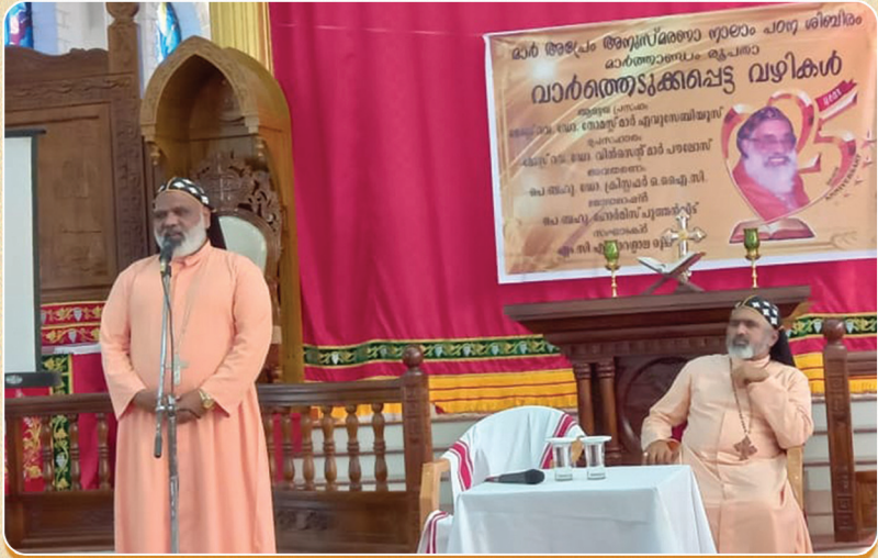
ഭദ്രാസനസ്മരണാർഹനായ ലോറിൻസ് മാർ അപ്രേം അനുസ്മരണ പഠന ശില്പിമാ