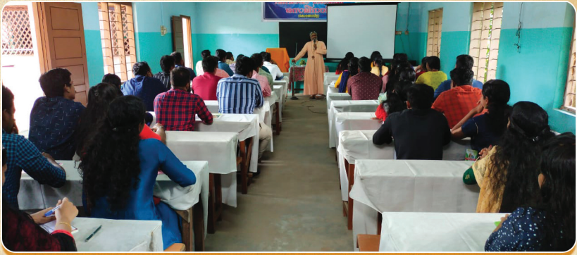
വിവാഹ ഒരുക്ക സെമിനാർ നവംബർ 2021