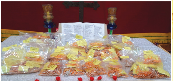
നെയാറ്റിൻകര വൈദിക ജില്ലയുടെ ജപമാല മാസാചരണം