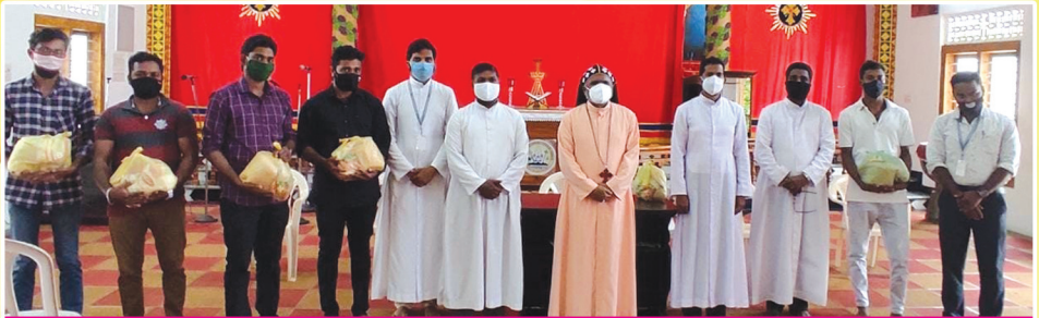
യുവജന ദിനാഘോഷങ്ങളുടെ ഭാഗമായുള്ള ഭക്ഷ്യകിറ്റ് വിതരണ ഉദ്ഘാടനം