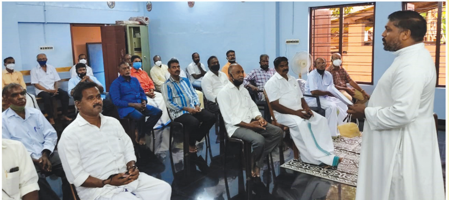
പാറശ്ശാല ഭദ്രാസന ഉപദേശി സംഗമം