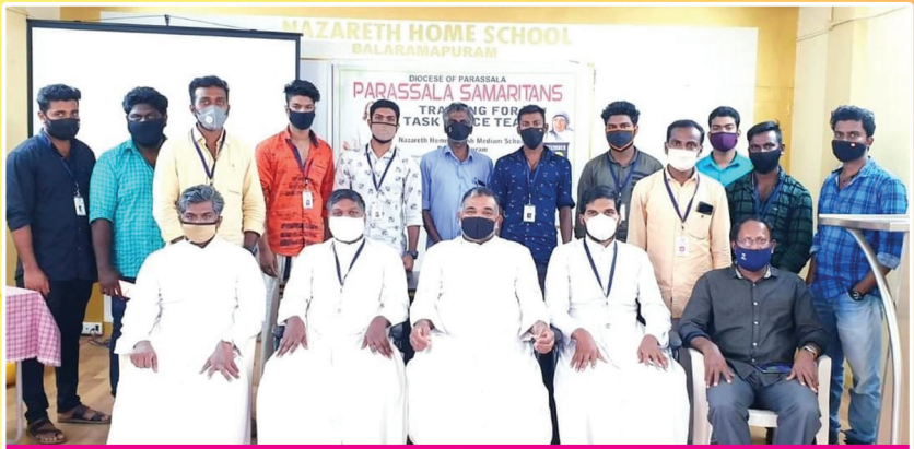
പാറശ്ശാല ഭദ്രാസനത്തിലെ സമരിറ്റൻസ് ടീം