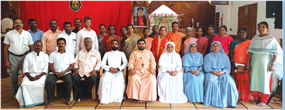
പാഠശാലാ ഭദ്രാസനത്തിലെ സുവിശേഷ സംഘാംഗങ്ങൾ