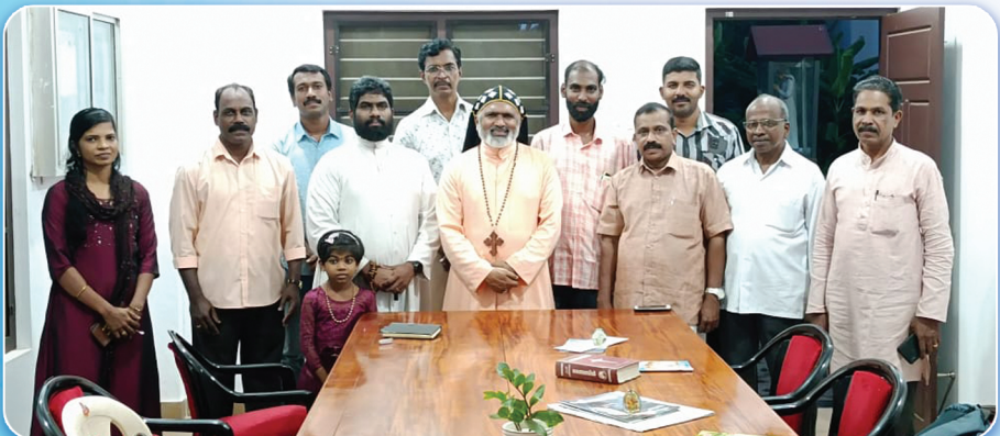
കെ.സി.ബി.സി. മദ്യവിരുദ്ധ സമിതിയുടെ പാറ്റുലാല ഭദ്രാസനതല ഭാരവാഹികൾ അഭിവന്ദ്യ പിതാവിനോടൊപ്പം