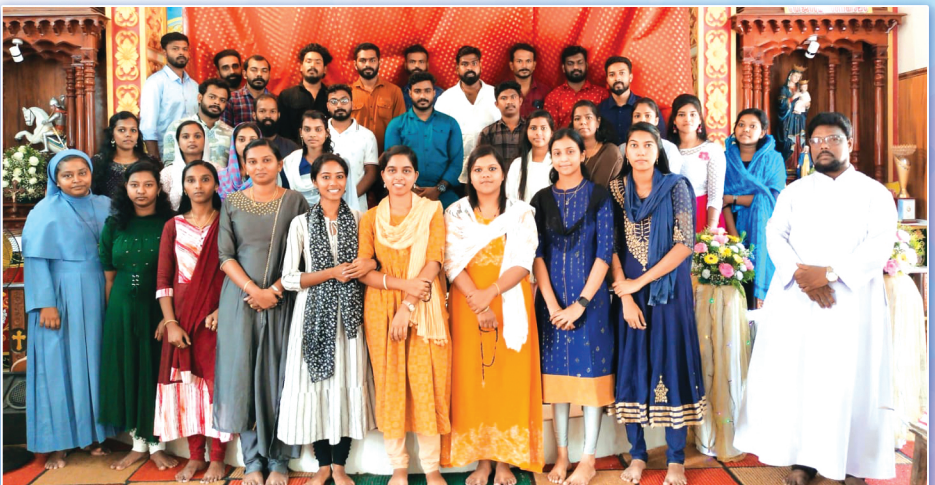
ആഗസ്റ്റ് മാസം 14, 15 തീയതികളിൽ കൊടങ്ങാവിളയിൽ വച്ച് നടന്ന വിവാഹ ഒരുക്ക സെമിനാറിൽ പങ്കെടുത്തവർ