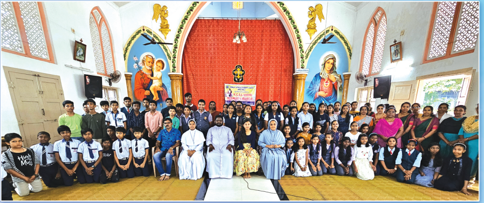
കെ.സി.എസ്.എൽ. പാഠശാലാ ഭദ്രാസന ആനിമേഷൻ & ലീഡേഴ്സ് മീറ്റ് 2023