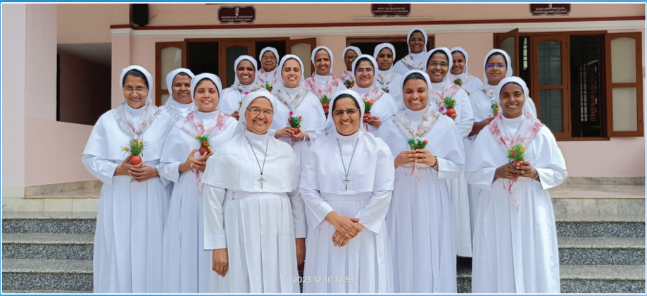
മേരീമക്കൽ സന്യാസിനീ സമൂഹത്തിലെ കനക - രജത ജൂബിലി ആഘോഷിക്കുന്ന സിസ്റ്റേഴ്സ്