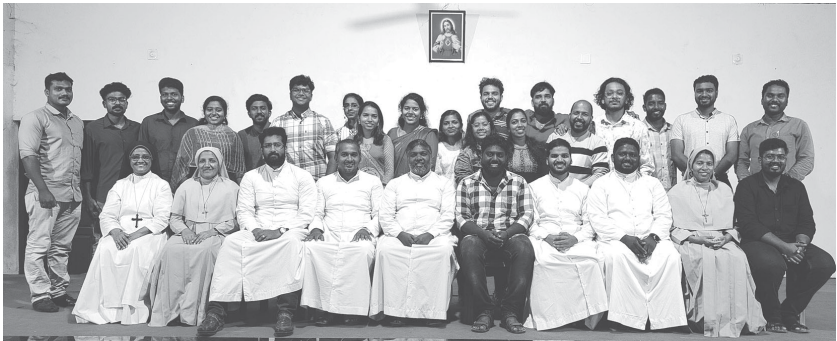
പാറശ്ശാല ഭദ്രാസനത്തിലെ എം.സി.വൈ.എം.ന്റെ 2024 വർഷത്തെ