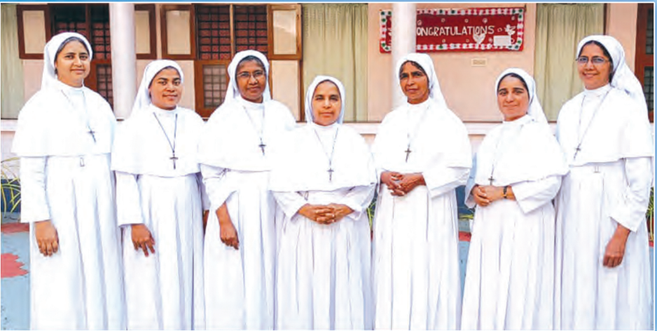
മേരീമക്കൽ സന്യാസിനീ സമൂഹം നിർമ്മല പ്രൊവിൻസ് പുതിയ പ്രൊവിൻഷ്യൽ ടീം