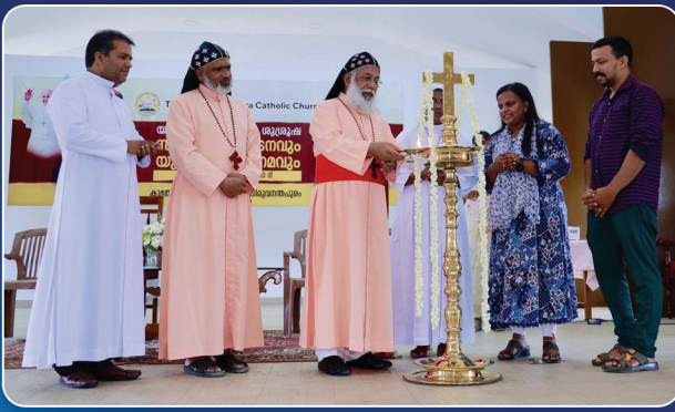
Apostolate for accompanying young families സമ്മേളനം അത്യഭിവന്ദ്യ മോറൻ മോർ ബസേലിയോസ് ക്ലീമീസ് കാതോലിക്കാബാവ ഉദ്ഘാടനം ചെയ്യുന്നു