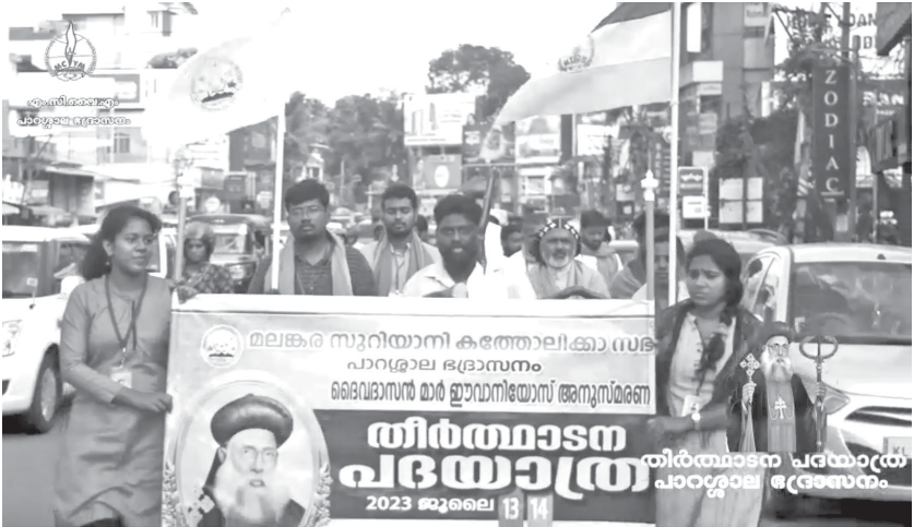
ദൈവദാസൻ മാർ ഈവാനിയോസ് അനുസ്മരണ തീർത്ഥാടന പദയാത്ര