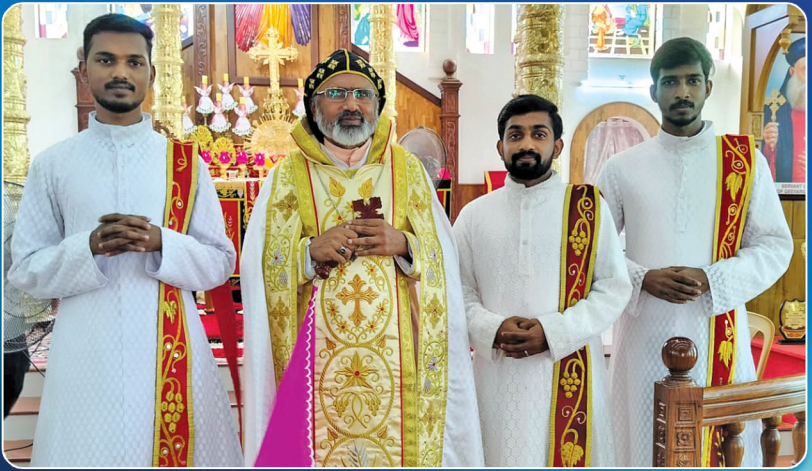
പൂർണ്ണ ശ്രമോത്സവം സ്വീകരിച്ചവർ അഭിവന്ദ്യ തോമസ് മാർ യൗസേബിയോസ് മെത്രാപ്പോലീത്തായോടൊപ്പം