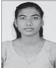
ലീന എൽ. പി. തിരുവല്ലം, ബാലരാമപുരം