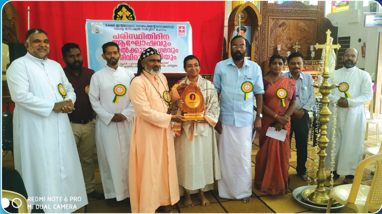
അന്താരാഷ്ട്ര പരിസ്ഥിതി ദിനാഘോഷം