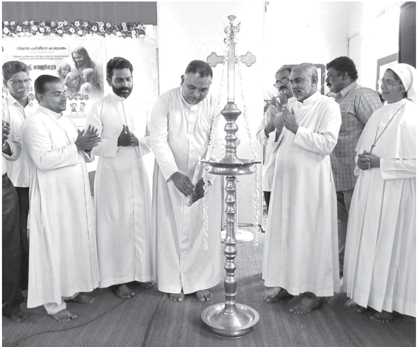
വിശ്വാസ പരിശീലന ക്ലാസുകൾ ഇടവകകളിൽ ഔദ്യോഗിക