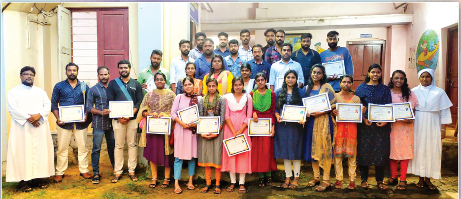
2022 ഡിസംബർ മാസം 2, 3 തീയതികളിൽ കൊടങ്ങാവിളയിൽ വച്ച് നടന്ന വിവാഹ രെക്ക സെമിനാറിൽ പങ്കെടുത്തവർ