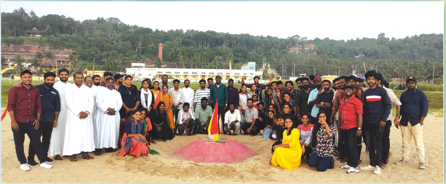
എം.സി.വൈ.എം. - അസ്സീസിയൻ സൗഹൃദതിരം