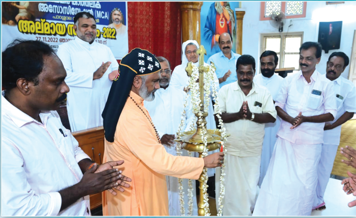
എം.സി.എ. - അലമായ, കർഷക, ഉദ്യോഗസ്ഥ സംഗമം അഭിവന്ദ്യ തോമസ് മാർ യേശുബിയോസ് തിരുമേനി ഉദ്ഘാടനം ചെയ്യുന്നു