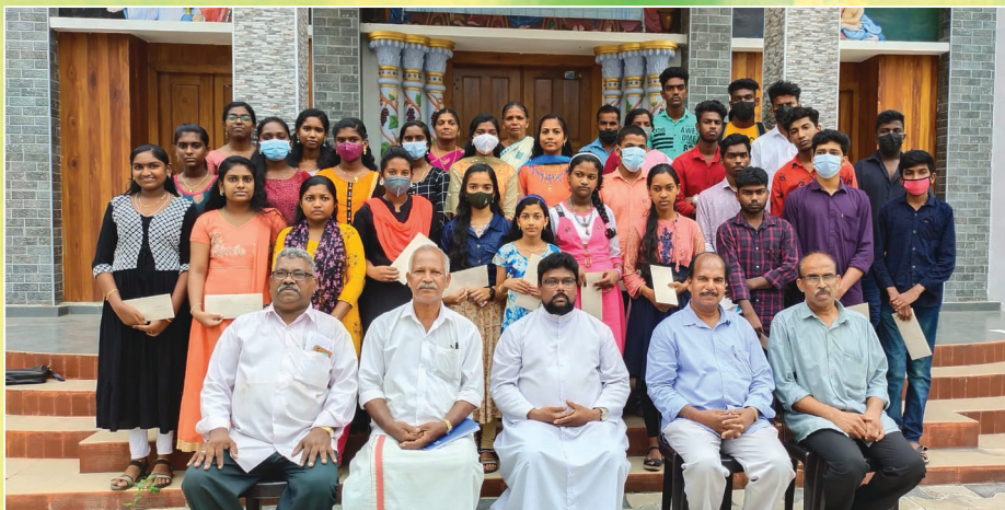
വിൻസെന്റ് ഡിപോൾ സൊസൈറ്റി പാറശ്ശാല സെൻട്രൽ കൗൺസിലിന്റെ ആഭിമുഖ്യത്തിൽ നടത്തിയ എജ്യൂക്കേഷൻ ഗ്രാന്റ് വിതരണം