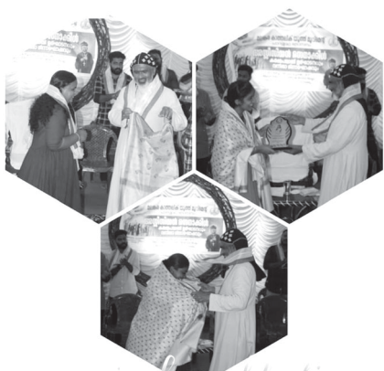
women's day celebration