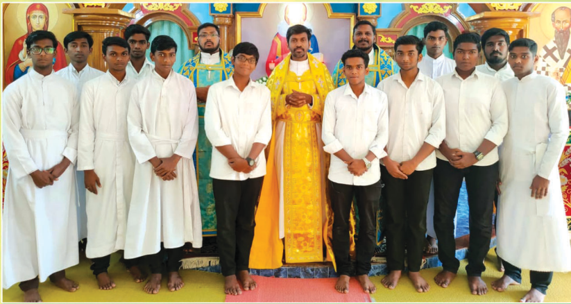
പാറശ്ശാല സ്നേഹദീപം മൈനർ സെമിനാരി വൈദിക വിദ്യാർത്ഥികൾ ബഹു. വൈദികരോടൊപ്പം