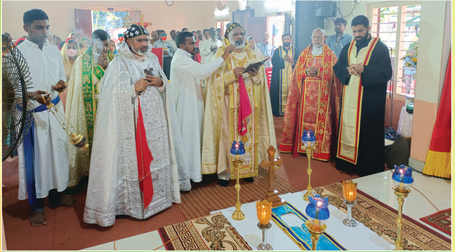
ഭാഗ്യസ്മരണാർഹനായ ലോറൻസ് മാർ അപ്രേം തിരുമേനിയുടെ 25-ാം ഓർമ്മപ്പെരുന്നാൾ