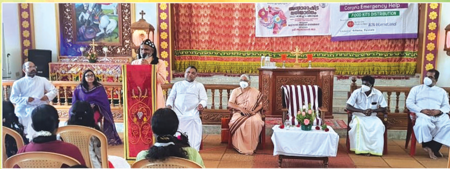
ക്ഷേമയുടെ ആഭിമുഖ്യത്തിൽ സംഘടിപ്പിച്ചു വന്നിരുന്ന ദിനാഘോഷം