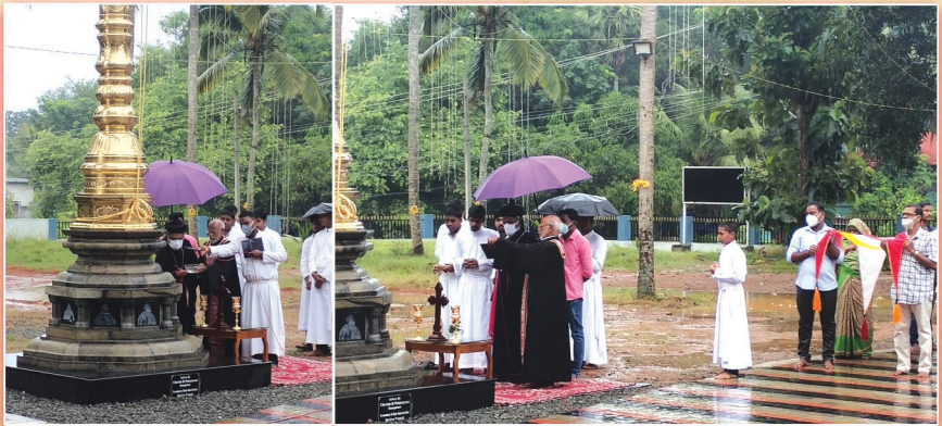
പാറ്റർണൽ കത്തീഡ്രൽ ദൈവാലയത്തിലെ കൊടിമരം അഭിവന്ദ്യ ഡോ. തോമസ് മാർ യൗസേബിയോസ് തിരുമേനീ കുദാശ ചെയ്യുന്നു.