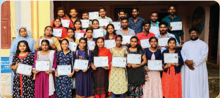
വിവാഹ ഒരുക്കസെമിനാറിൽ പങ്കെടുത്തവർ (2022 മെയ് 6, 7)