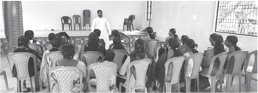
ചെമ്പരത്തിവിള യൂണിറ്റിൽ വച്ച് നടത്തപ്പെട്ട ഫെഡറേഷൻ മീറ്റിംഗ് പരിസ്ഥിതി ദിനാചരണം

കേരള സോഷ്യൽ സർവീസ് ഫോറവും ക്ഷേമയും സംയുക്തമായി അന്താരാഷ്ട്ര പരിസ്ഥിതി ദിനാചരണം 2022 ജൂൺ 5-ാം തീയതി അമ്പി