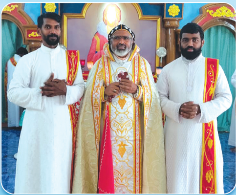
പൂർണ്ണ ശൈശവപട്ടം സ്വീകരിച്ചവർ