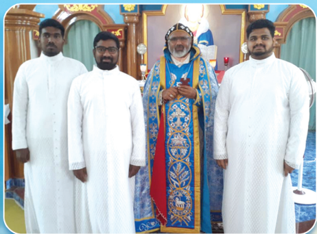
വൈദിക വസ്ത്രം സ്വീകരിച്ചവർ