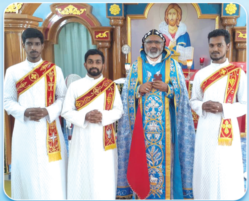
ഹെർപ്പിസൈറ്റോക്സോ പട്ടം സ്വീകരിച്ചവർ