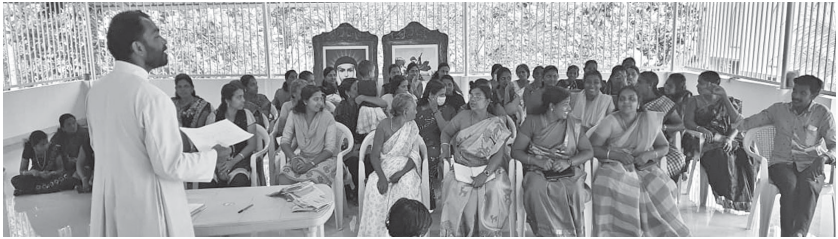
പിൻകുളം യൂണിറ്റിൽ വച്ച് നടത്തപ്പെട്ട ഫെഡറേഷൻ മീറ്റിംഗ്