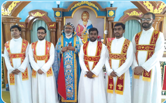
കോറുയോ പട്ടം സ്വീകരിച്ചവർ